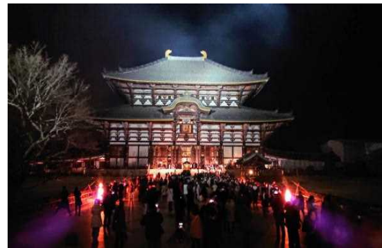
【奈良・東大寺よりH31.1.1撮影】

東大寺の大仏殿には、観相窓という扉のついた小さな窓があります。観相窓が開くのは、年にたった2回だけ。8月15日の万灯供養会の夜（実際はお盆の3日間）と元日の0時から翌朝8時まで。普段とは違う大仏様のお顔を拝むことができます。見えますか？