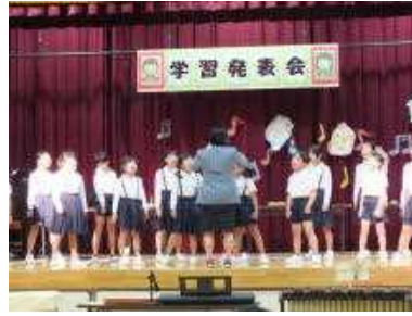
全校斉唱 「いつだって」

11月4日(木)、学習発表会が開催され、これまで日々の様々な学習に一生懸命取り組んできた成果を、保護者の皆様の前で披露しました。どの学年の発表もすてきでした。アイデアいっぱい、笑いもある楽しい発表でした。お忙しい中、お越しいただいた皆様、大変ありがとうございました。