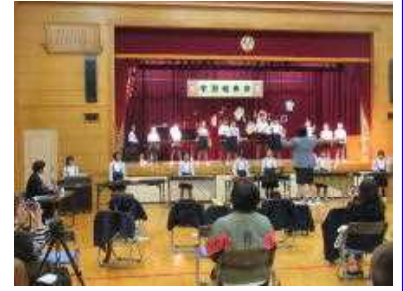
全校合奏「上を向いて歩こう」