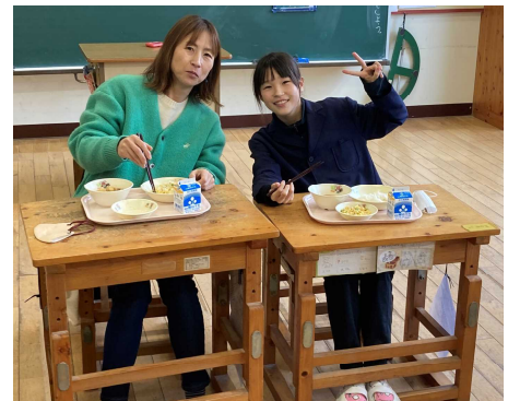
『思い出の親子給食』

「夢に向かって日々前進」。夢をもち、その実現に向けて努力することは、自分を伸ばし高める上で大切なことであり、よりよい自分をめざして自らを成長させることにもつながります。本校卒業生としての誇りをもち、夢の実現に向けて、自分の将来をしっかりと見つめながら、力強い前進とご活躍を願っています。