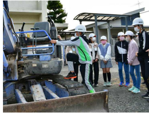
【5・6年生】 測量・重機乗車の体験