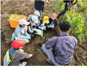
【1・2年生】 動食物とのふれ合い