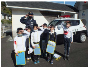
【1・2年生】大川派出所