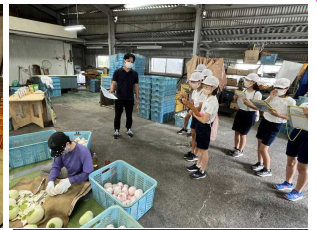
【5・6年生】泰平食品さん

今学期は、地元で働いている方々を児童が訪問し、地元の産業や職業について学ぶ機会がたくさんありました。皆さんお忙しい中、とても親切丁寧に教えてくださいました。ありがとうございました。