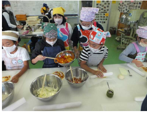
【3・4年生】 ピザ作りに挑戦