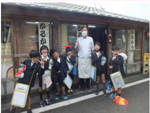
【1・2年生】ふくやさん