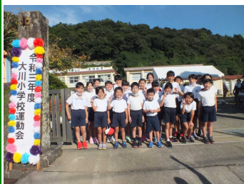
校門にて全児童で

今年も、新型コロナウイルス感染症拡大の状況を鑑み、校区との合同体育祭は中止し、本校単独で、規模を縮小して、児童及び保護者の出場する種目のみで開催しました。また、保護者及び親族のみに来場者を制限し、来賓や地域の皆様の来場は見合わせていただいた開催となりました。地域の皆様の御理解・御協力に感謝申し上げます。ほんの少しではありますが、児童のがんばった姿を紹介します。