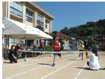
色別対抗全員リレー