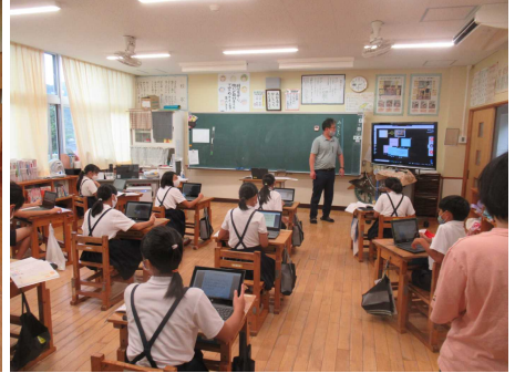
5・6年生 「みんなでいつでも協力するには」