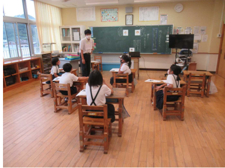
3・4年生 「同じなかまだから」